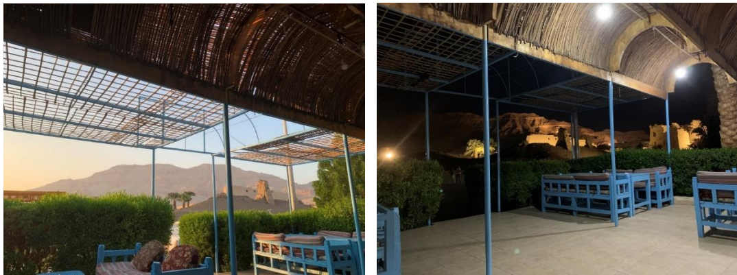
Quel décor fabuleux pour une école ! la montagne où reposent de nombreux pharaons et le Temple de Medinet Habou

Le Soutien Scolaire est très utile pour les enfants du primaire et du secondaire car l'éducation. Et ces cours leur permettent de réviser, de poser des questions, d'aller plus loin.