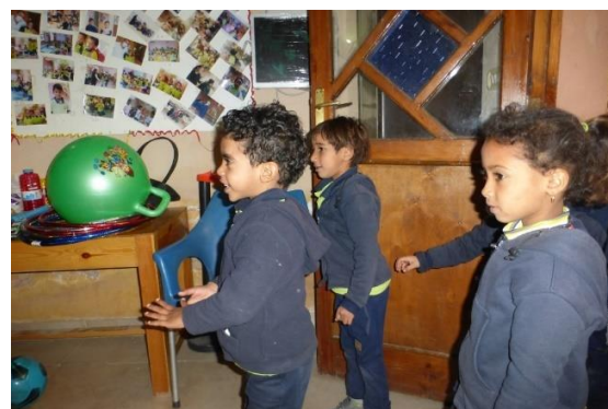
De nouveaux jeux