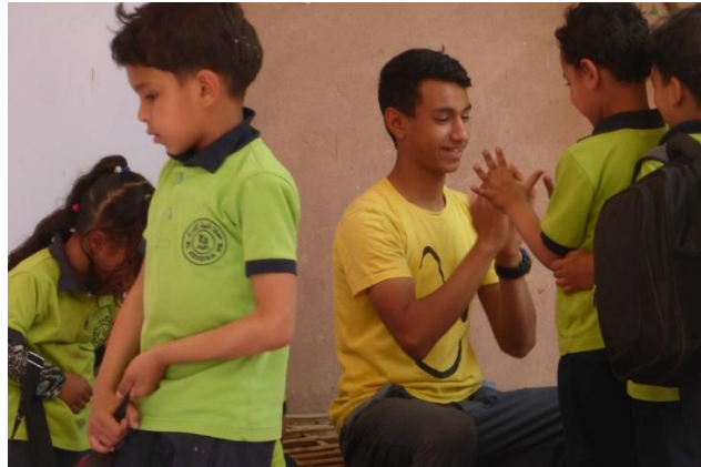
Medo vient aider