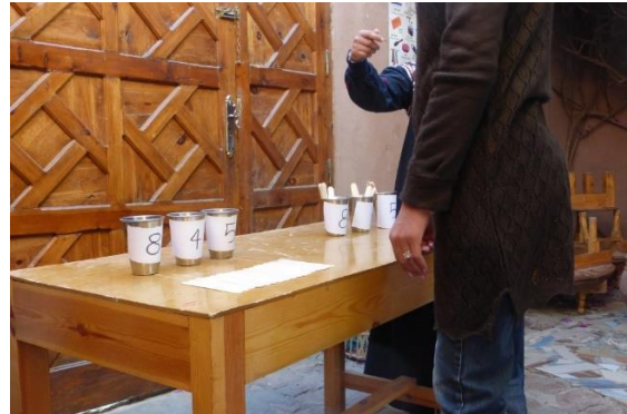
Au bout de la course, un exercice de calcul attend les enfants