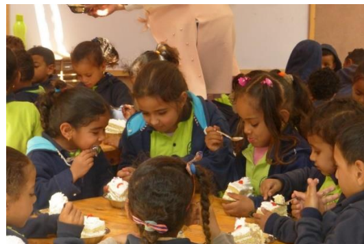
Des yaourts et les jours de fête, ils ont parfois droit à un gros gâteau. Un peu trop gros !

Le samedi après-midi est consacré aux activités ludiques et sportives. Mais aussi aux histoires et à la découverte des plantes