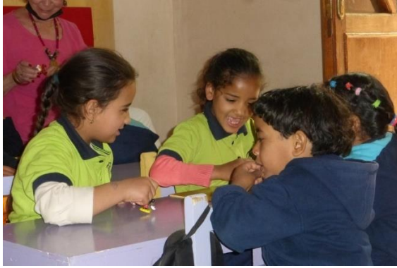
les enfants jouent avec les playmobils qu'ils ont reçus.