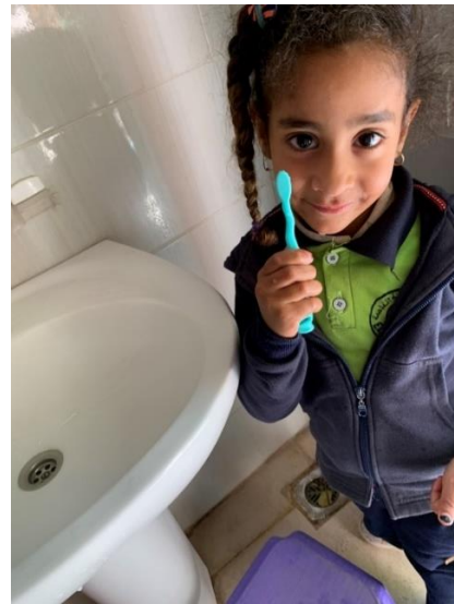
Après les collations, on va se laver les dents !

Les médicaments prescrits pour le soin des dents ont été remis aux familles.