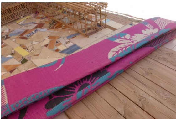
De nouveaux tapis