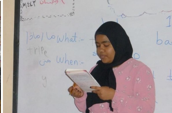
A chacune son exposé